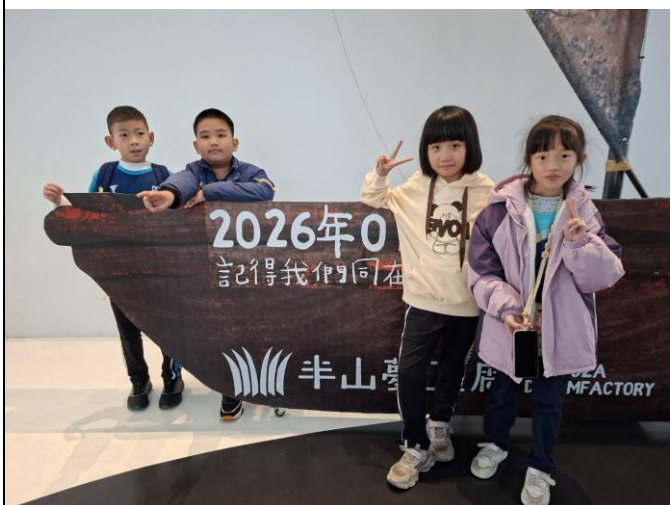
說明：半山夢工廠前合影