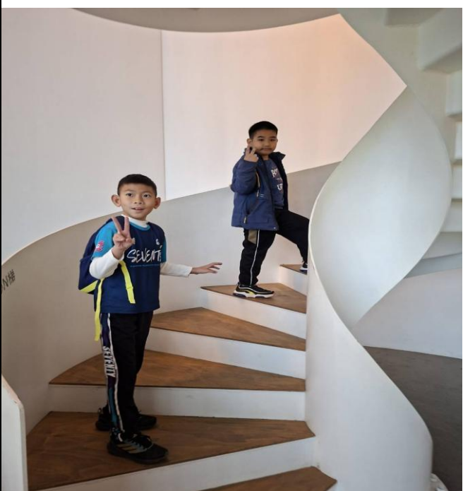
說明：自由參觀跟購買