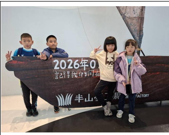
說明：半山夢工廠前合影