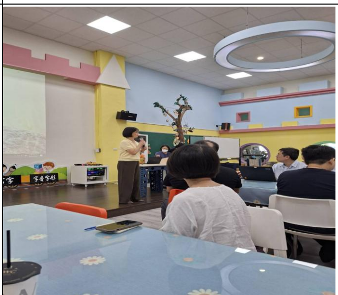
說明：研習當天組員心得分享報告