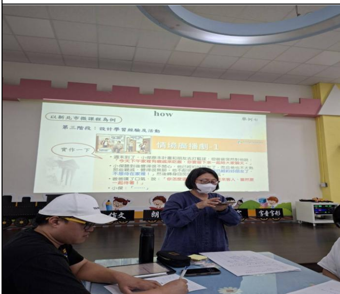
說明：研習當天組員相互討論熱烈