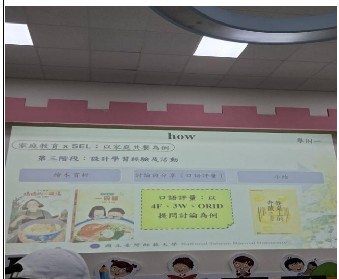
說明：研習地點僑光國小